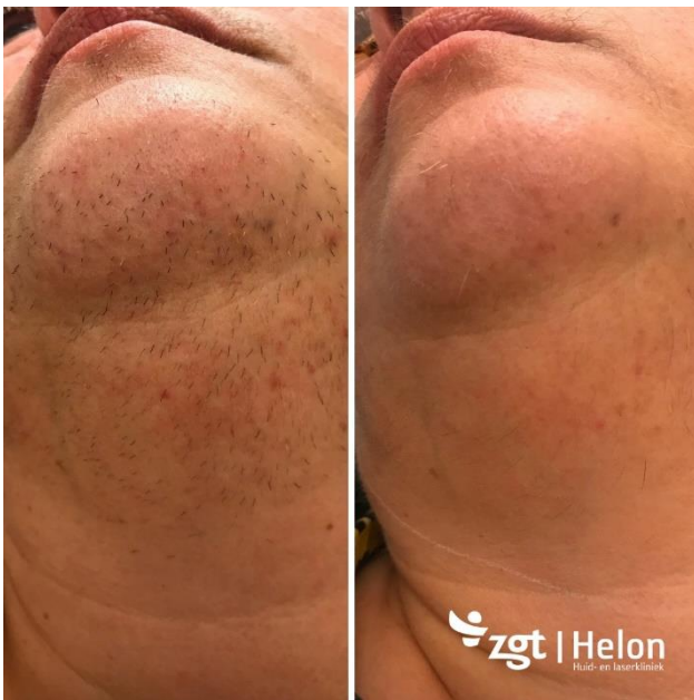
(Indicatie: hirsutisme. Resultaat na 4 behandelingen)

Zowel het aantal behandelingen, als de tussenpoos is afhankelijk van de soort beharing en de locatie op het lichaam. Het aantal behandelingen dat nodig is voor een optimaal resultaat ligt gemiddeld tussen de 5 en 10 behandelingen. De behandelingen vinden plaats in kuurvorm met tussenpozen van zes tot tien weken. Dit heeft te maken met de groeicyclus van de haren. De groeicyclus van het haar bestaat uit drie fases: de groeifase, de rustfase en de regressiefase. Slechts de haren in de groeifase zijn gevoelig voor de laserbehandeling. Om zo effectief mogelijk te behandelen, dient de behandeling met tussenpozen herhaald te worden.