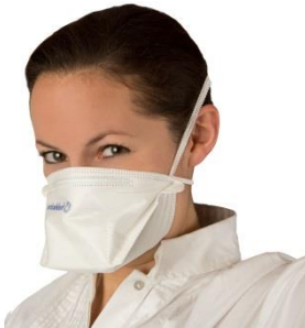
Figuur - mondneusmasker