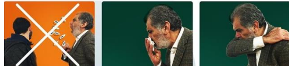
Figuur - hoestinstructie

Als een ander deze bacteriën inademt, kan hij worden besmet. Hoest daarom in een zakdoek of uw elleboog, zie figuur hoestinstructie .