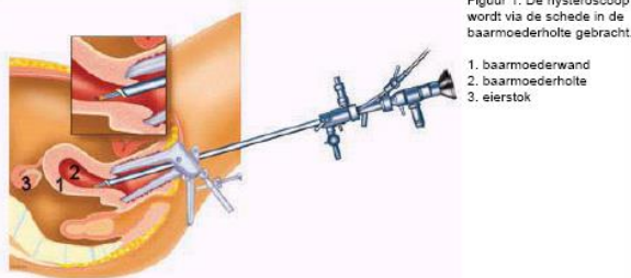
Figuur 1. De hysteroscoop wordt via de schede in de baarmoederholte gebracht.

De hysteroscoop is een dunne holle buis waar een lichtbundel doorheen gaat. Om de binnenkant van de baarmoeder goed zichtbaar te maken, brengt de gynaecoloog tijdens de hysteroscopie vloeistof naar binnen. Vaak sluit men de hysteroscoop aan op een camera. Het beeld is dan op een beeldscherm te zien en u kunt meestal meekijken. (zie figuur 1)