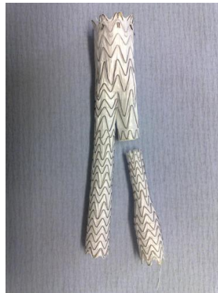
Afbeelding 1: endoprothese

De chirurg heeft met u besproken dat u via de endovasculaire procedure wordt geopereerd. Deze procedure kan uitsluitend worden toegepast als er aan een aantal voorwaarden wordt voldaan. Zo mogen