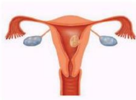
Figuur 3. Een myoom in de baarmoederholte kan door middel van een hysteroscopie worden gezien en verwijderd