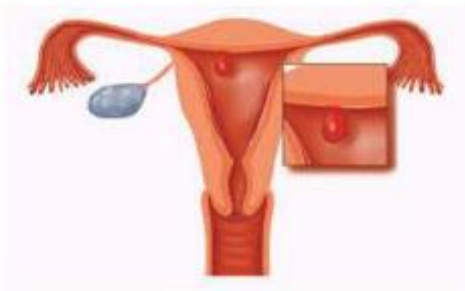
Figuur 2. Een poliep in de baarmoederholte kan door middel van hysteroscopie worden gezien en verwijderd

Nederlandse Vereniging voor Obstetrie en Gynaecologie (NVOG) te Utrecht: nvog.nl .