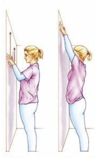
Figuur 7. Ga een stukje (15 cm) van de muur staan en "krabbel" met beide handen tegelijkertijd langs de muur naar boven.