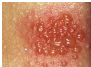
Sterk positieve plakproef