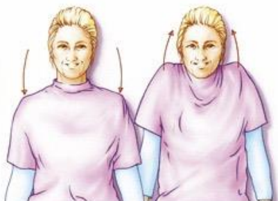
Figuur 1. Laat uw armen langs uw lichaam hangen. Vervolgens een aantal keren uw schouders optrekken en weer ontspannen. Rondraaien mag ook.

( na OKD de eerste 5 dagen maximaal tot 90 graden oefenen)