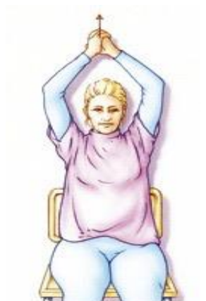
Figuur 5. Uw handen in elkaar vouwen. Daardoor wordt uw arm aan de geopereerde kant gesteund. Uw armen zo ver mogelijk gestrekt omhoog brengen.