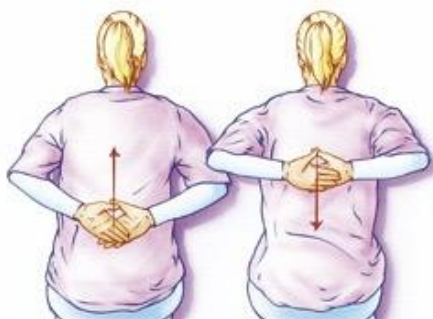
Figuur 2. Leg uw handen zo laag mogelijk op uw rug en schuif ze langs uw rug naar boven.