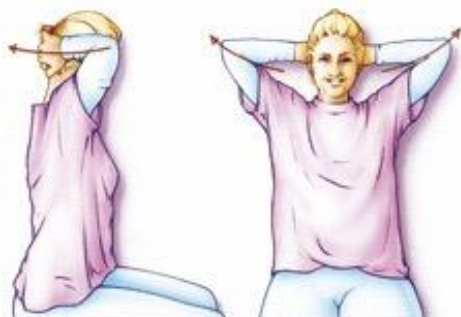
Figuur 3. Uw handen in uw nek of achter uw hoofd leggen en vervolgens uw vingers ineen strengelen. Houd uw ellebogen eerst ontspannen naar voren en breng ze daarna zo ver mogelijk naar achteren. Let op rechtop zitten.