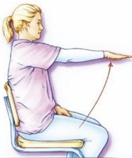
Figuur 2. Beweeg uw arm gestrekt voorwaarts. Ga niet verder dan schouderhoogte (dus tot maximaal 90 graden). Deze beweging mag ook zijwaarts tot schouderhoogte.