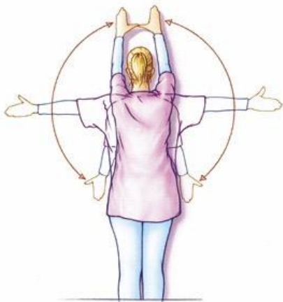
Figuur 8. Staande tegen de muur beide armen zijwaarts omhoog brengen, zo hoog u kunt. Uw handen blijven contact houden met de muur. U mag deze beweging ook in de vrije ruimte doen.