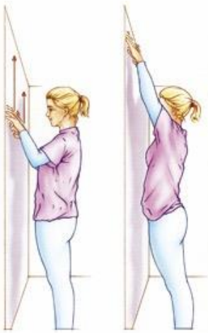
Figuur 7. Ga een stukje (15 cm) van de muur staan en "krabbel" met beide handen tegelijkertijd langs de muur naar boven. Als u de maximale hoogte bereikt hebt tilt u de hand van de muur.