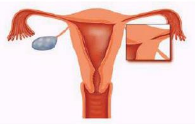
Figuur 4. Een verkleving in de eileiderhoek

- Opheffen van geringe verklevingen in de baarmoederholte Dunne verklevingen tussen de voor- en achterwand zijn eenvoudig door te knippen. Voor dikkere en uitgebreide verklevingen (syndroom van Asherman) is een grotere operatie (therapeutische hysteroscopie) nodig (zie figuur 4).