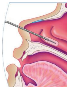
coblatienaald in onderste neusschelp