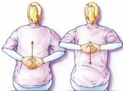
Figuur 2. Leg uw handen zo laag mogelijk op uw rug en schuif ze langs uw rug naar boven.