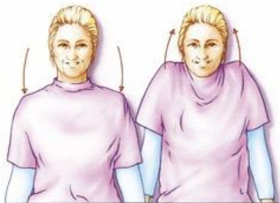
Figuur 1. Laat uw armen langs uw lichaam hangen. Vervolgens een aantal keren uw schouders optrekken en weer ontspannen. Ronddraaien mag ook.