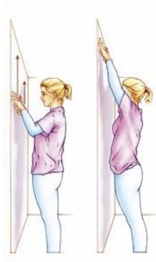
Figuur 6. Ga een stukje (15 cm) van de muur staan en "krabbel" met beide handen tegelijkertijd langs de muur naar boven.