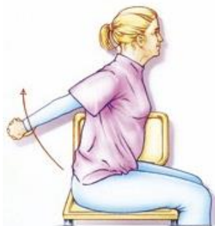
Figuur 4. Uw handen achter uw rug in elkaar houden. Vervolgens uw armen gestrekt omhoog brengen.