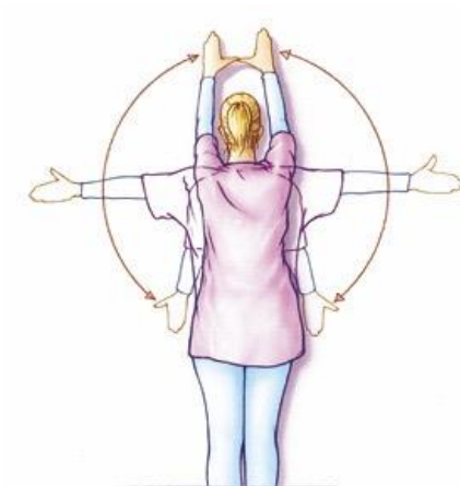
Figuur 7. Staande tegen de muur beide armen zijwaarts omhoog brengen, zo hoog u kunt. Uw handen blijven contact houden met de muur. U mag deze beweging uiteindelijk ook in de vrije ruimte maken.