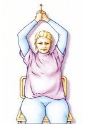
Figuur 5. Uw handen in elkaar vouwen. Daardoor wordt uw arm aan de geopereerde kant gesteund. Uw armen zo ver mogelijk gestrekt omhoog brengen.