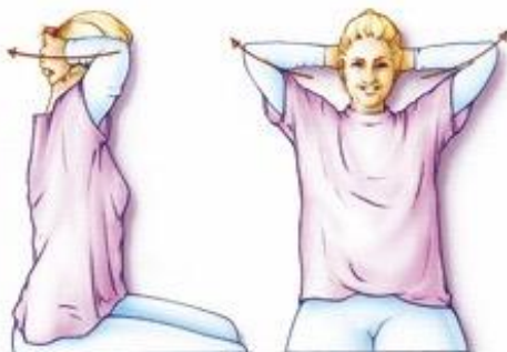
Figuur 3. Uw handen in uw nek of achter uw hoofd leggen en vervolgens uw vingers ineen strengelen. Houd uw ellebogen eerst ontspannen naar voren en breng ze daarna zo ver mogelijk naar achteren. Let op rechtop zitten.