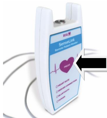
Afbeelding 2: eventknop om te drukken bij klachten

Hebt u erge klachten? Wacht niet tot het inleveren van de apparatuur, maar bel het ziekenhuis. Bij spoed belt u 112.