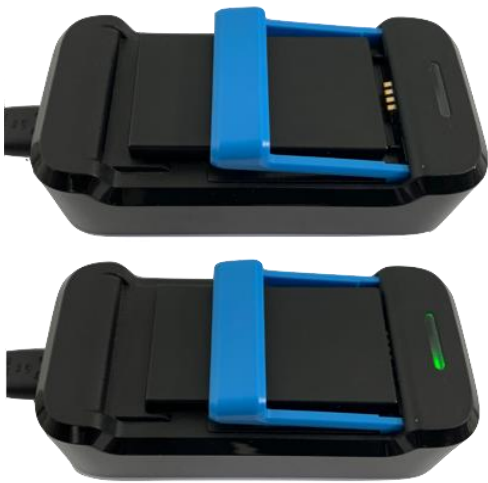
Afbeelding 5: onjuist geplaatste accu Afbeelding 6: volledig opgeladen accu

De oplader heeft een lampje en deze heeft de volgende betekenissen: