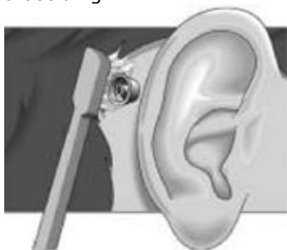
Afbeelding 4. Hygiëne rondom de overgang huidimplantaat is belangrijk

Het is belangrijk dat u de huid rondom de schroef goed schoonhoudt. Eventuele korstjes rondom de schroef kunt u laten inweken met wat babyolie. De korstjes kunt u vervolgens verwijderen door een wattenstaafje te gebruiken. De schroef zelf kunt u eventueel schoonmaken met een zachte borstel, zie afbeelding 4.