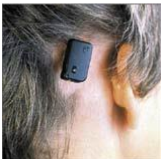
Afbeelding 3: De BAHA is op de schroef bevestigd

Een BAHA kan ook een oplossing zijn voor mensen met een éénzijdige doofheid. In dit geval wordt de BAHA op de dove zijde geplaatst. Op deze manier wordt het geluid door de BAHA opgevangen en via de schedel afgegeven aan het goed functionerende oor aan de andere zijde. Afhankelijk van uw gehoorverlies kan een BAHA aan één of aan beide zijden geplaatst worden. U komt in aanmerking voor een BAHA als u een gehoorverlies van meer dan 35 dB heeft, dat niet door andere hoorhulpmiddelen of een operatie te verbeteren is.