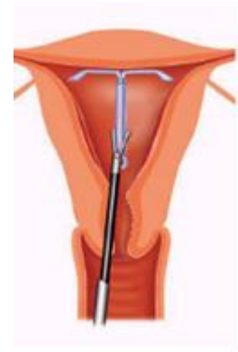
Figuur 5. Verwijderen van IUD waarvan touwtje niet te vinden is.

- Opheffen van geringe verklevingen in de baarmoederholte Dunne verklevingen tussen de voor- en achterwand zijn eenvoudig door te knippen. Voor dikkere en uitgebreide verklevingen (syndroom van Asherman) is een grotere operatie (therapeutische hysteroscopie) nodig (zie figuur 4).