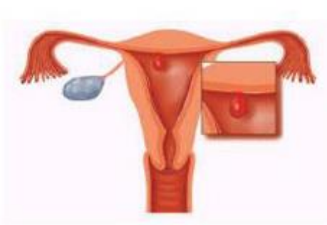
Figuur 2. Een poliep in de baarmoederholte kan door middel van hysteroscopie worden gezien en verwijderd