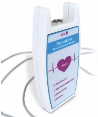
Afbeelding 2: eventknop om te drukken bij klachten

Hebt u erge klachten? Wacht niet tot het inleveren van de apparatuur, maar bel het ziekenhuis. Bij spoed belt u 112.